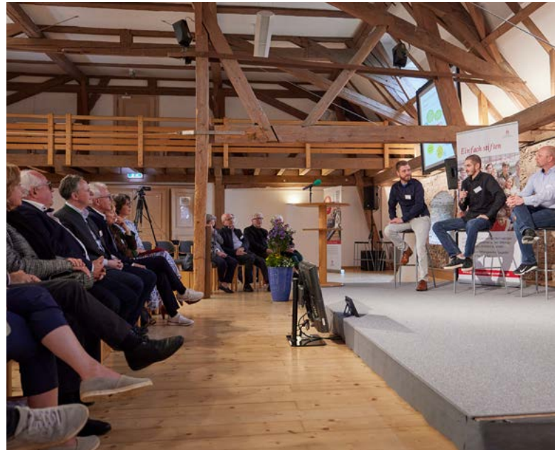
Eindrücke vom Stifterfest 2022

Fünf Stiftungen wurden im Jahr 2022 unter dem Dach der Don Bosco Stiftung gegründet, damit das Leben junger Menschen gelingt: ein Stiftungsfonds und vier Treuhandstiftungen. Auch drei Verbrauchsstiftungen sind darunter – diese Form des Stiftens wird immer beliebter. Das Stiftungsvermögen ist durch diesen Zuwachs sowie durch zahlreiche Zustiftungen auf